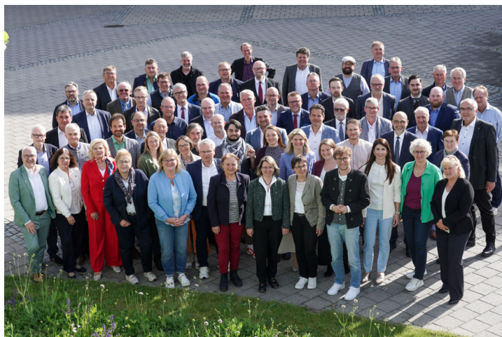
Bildunterschrift: Die Kreistagsmitglieder der Wahlperiode 2026 bis 2032 mit Landrat Marco Meier (vorderste Reihe, rechts).